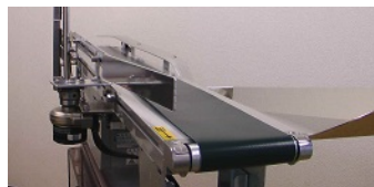
自動排出装置付コンベア