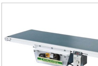
オプション：装置専用コンベア